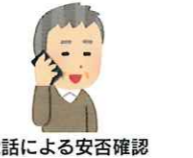
電話による安否確認