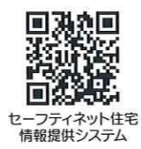
セーフティネット住宅 情報提供システム