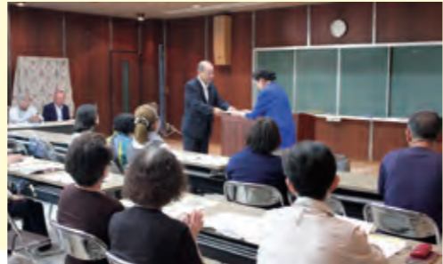
福祉委員委嘱状交付式