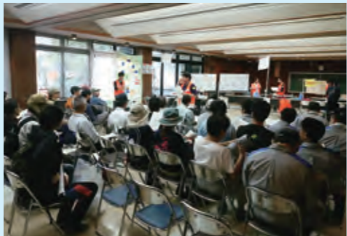
災害ボランティアセンター