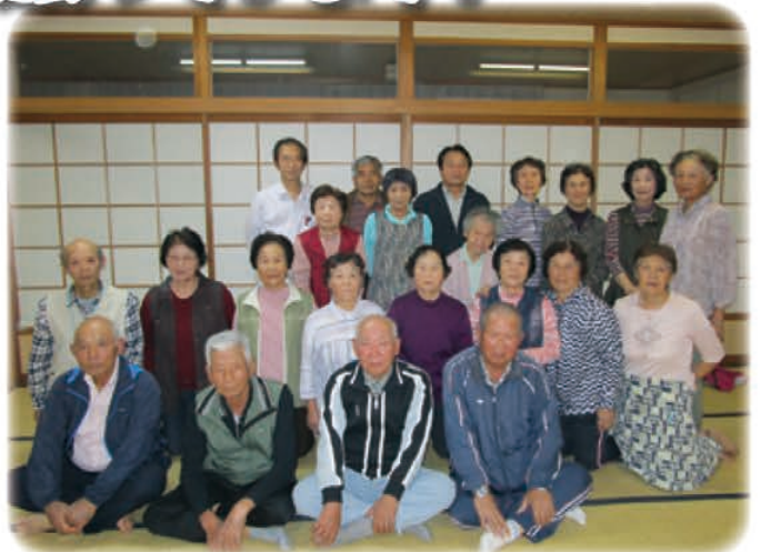
佐志生地区福祉推進協議会