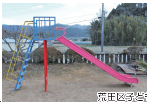
荒田区子ども公園の遊具改修