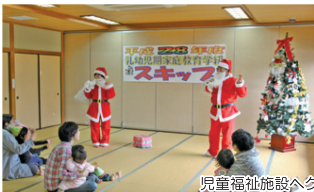
児童福祉施設へクリスマスプレゼント