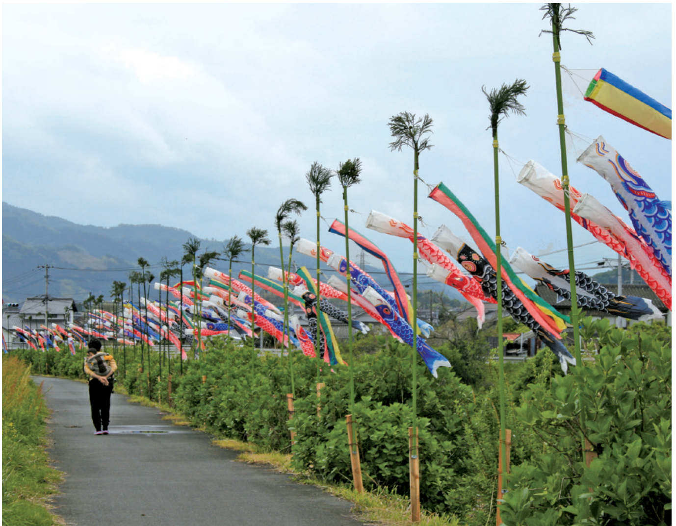
下北地区 熊崎川周辺