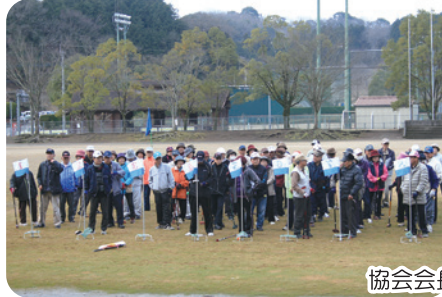
協会会長杯の様子