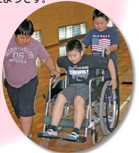
福良が丘小学校4年生