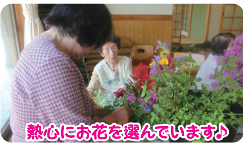
熱心にお花を選んでいきます♪