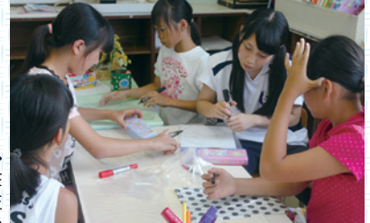
→ 昨年の様子 →