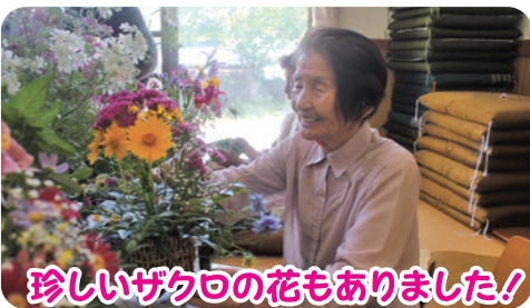
珍しいザクザクの花もありました！