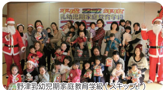
野津乳幼児期家庭教育学級(スキップ!)

10月1日から12月31日まで赤い羽根共同募金運動に取り組みました。市民皆様のご理解により、多くの募金が寄せられました。ご協力ありがとうございました。