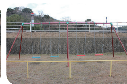
★熊崎・友田区こども公園の遊具改修★