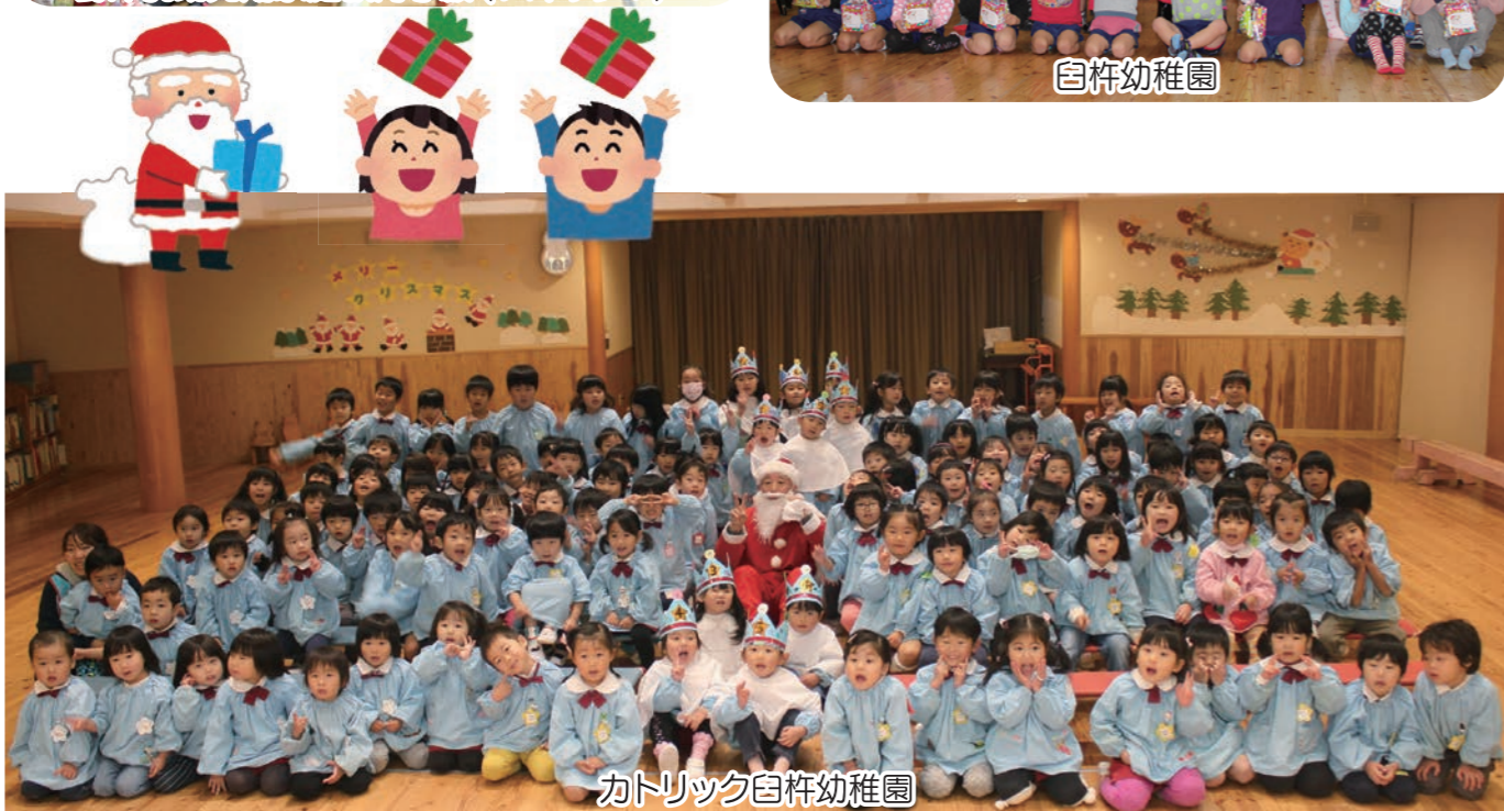
カトリック臼杵幼稚園