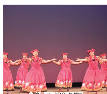
ハノハノフラ大分白杵教室