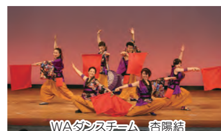
WAダンスチーム 杏陽結