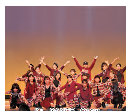
KII DANCE Crew