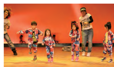
タイムス ダンススタジオ・みえダンススクール