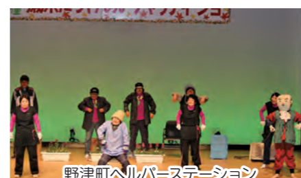
野津町ヘルプステーション