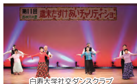
白寿大学社交ダンスクラブ