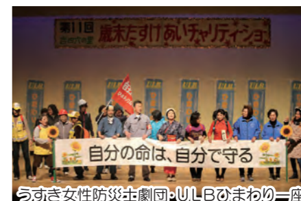
自分の命は、自分で守る うすき女性防災劇団・ULLBひまわり一座