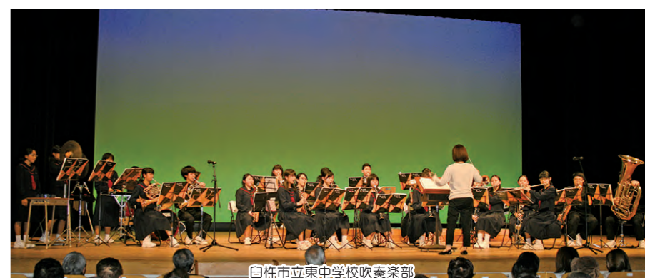
白杵市立東中学校吹奏楽部