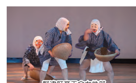
野津町商工会女性部