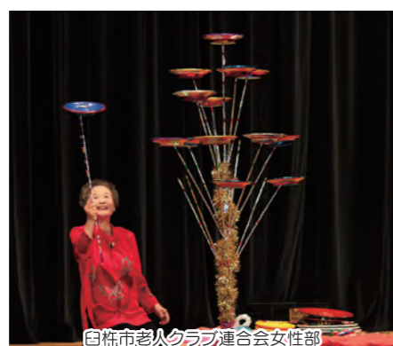
白杵市老人クラブ連合会女性部