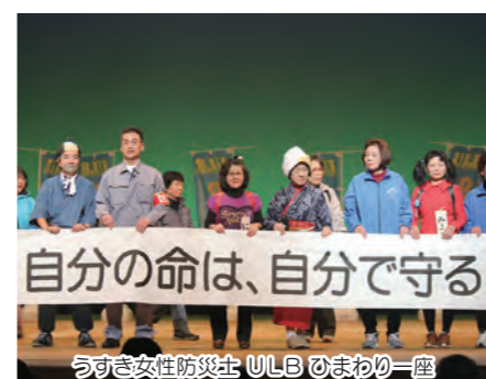
自分の命は、自分で守る うすき女性防災士 ULB ひまわり一座