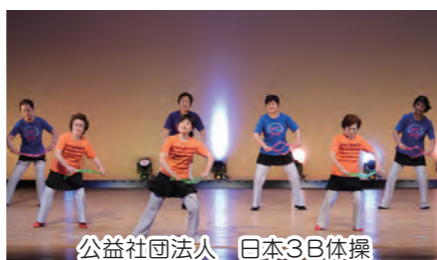
公益社団法人 日本3B体操