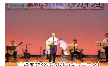
市役所親父バンド「コミュニティ」