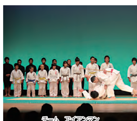
チーム アイアンマン