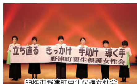
白寿市野津町更生保護女性会