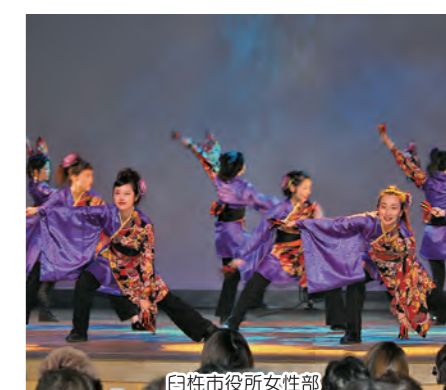
白杵市役所女性部