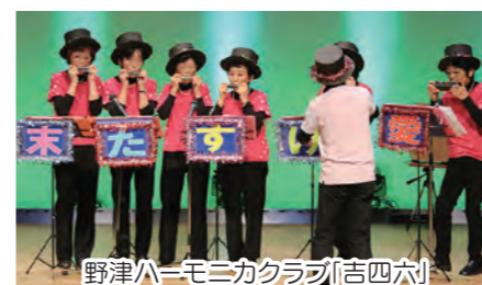
野津ホームニカクラブ(吉四六)