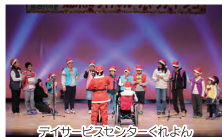
デイサービスセンターくれよん