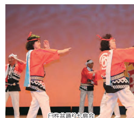
白杵盆踊り七島会