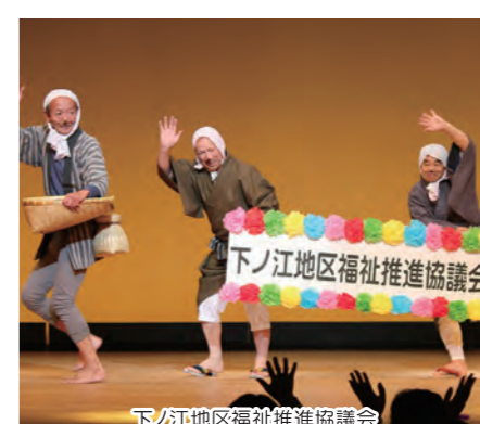
下ノ江地区福祉推進協議会