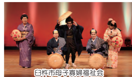
白寿市母子寡婦福祉会