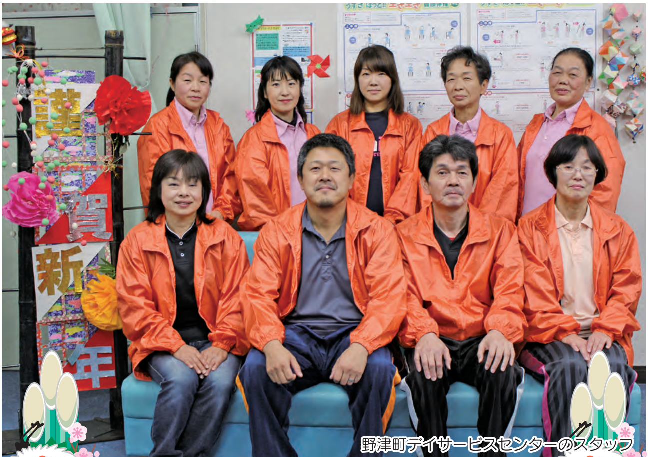
野津町デイサービスセンターのスタッフ