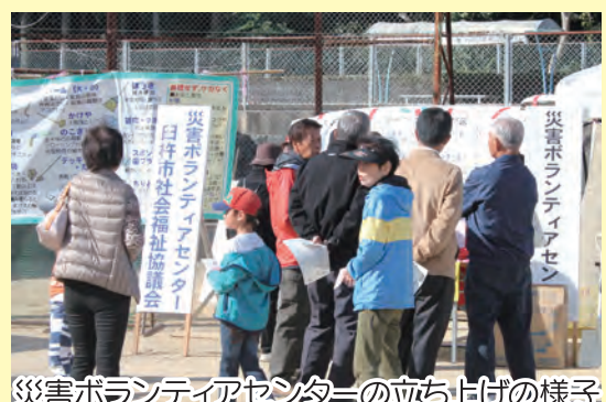
災害ボランティアセンターの立ち上げの様子

社会福祉協議会は災害ボランティアセンターの立ち上げを行い、ボランティアの受け入れや派遣を行う役割などについて説明をさせていただきました。