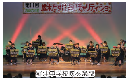
野津中学校吹奏楽部