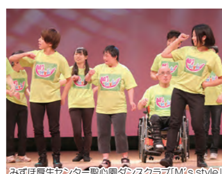
みずほ厚生センター聖心園ダンスクラブ[M's style]