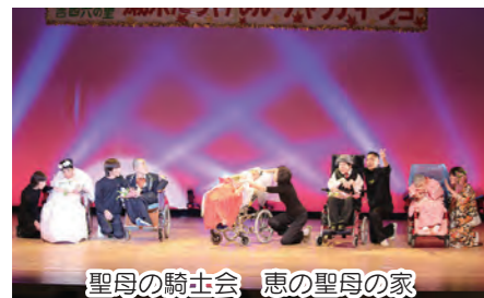
聖母の騎士会 恵の聖母の家