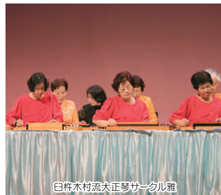
白杵木村流大正琴サークル雅