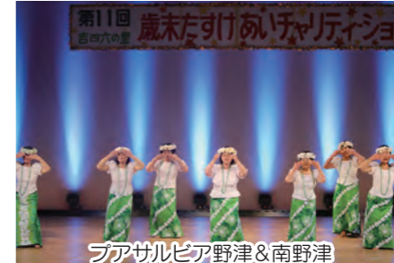
プアサルビア野津&南野津