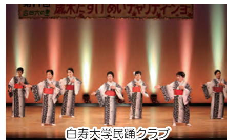
白寿大学民謡クラブ