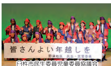
皆さんよい年越しを 野津地区 民生・児童委員 白寿市民生委員児童委員協議会