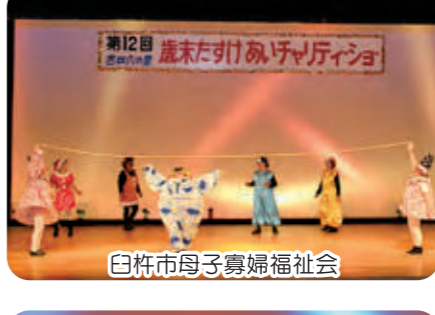
白杵市母子寡婦福祉会