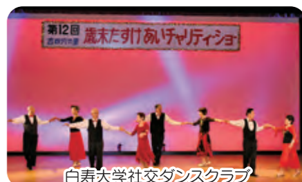
白寿大学社交ダンスクラブ