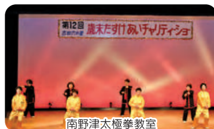
南野津太極拳教室