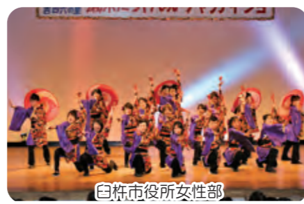
白杵市役所女性部