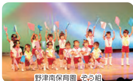
野津南保育園 そろ組