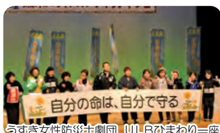
うすき女性防災士劇団 ULBのまわり一座