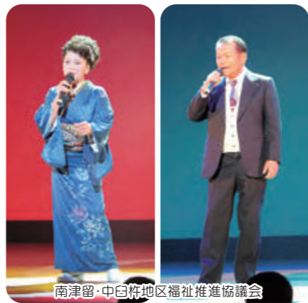
南津留・中臼杵地区福祉推進協議会