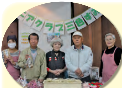
シニアクラブ三色すみれ

臼杵市大字望月112番地の1 TEL/0972-62-3630 FAX/0972-83-5650 e-mail:simominami@usukishakyo.ecnet.jp