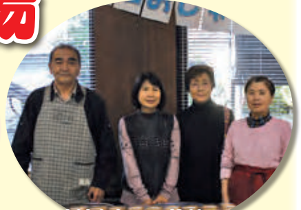
大泊おしゃべりサロン

11月3日 文化の日に、 社会福祉センターにて 第4回サロン市場を開催しました！ 社協登録サロン・老人クラブによる、 手作り自慢の品々が大好評でした！ たくさんのご来店、 ありがとうございました！！