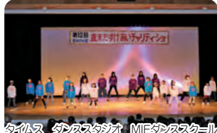
タイムス ダンススタジオ MIEダンススクール