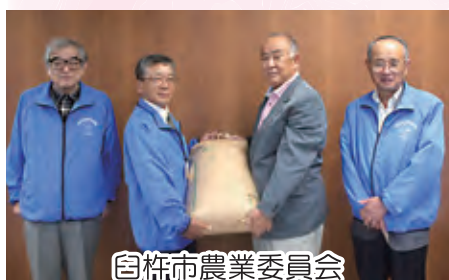
臼杵市農業委員会

下ノ江小学校は昨年に続き3回目となります。全校生徒51名で地域の方の指導のもと、下ノ江の「お米ランド」で田植えや稲刈りをして収穫したものです。