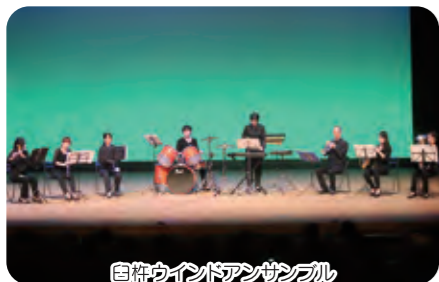
臼杵ウインドアンサンブル