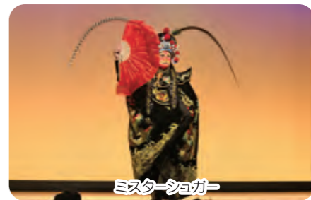
ミスターショウガ

12月4日(日)、臼杵市民会館において公演を行いました。約760名の方々にご協力いただき、収益金は925,602円となり、歳末たすけあい募金といたしました。市民皆様の温かい心に厚くお礼申し上げます。