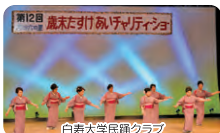
白寿大学民謡クラブ