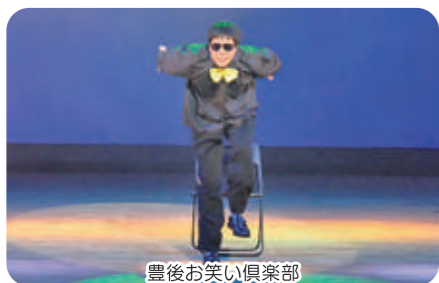
豊後お笑い倶楽部