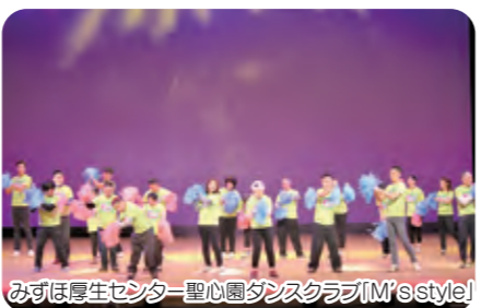
みすほ厚生センター 聖心園ダンスクラブ(M'sstyle)

12月4日(日)、臼杵市民会館において公演を行いました。約760名の方々にご協力いただき、収益金は925,602円となり、歳末たすけあい募金といたしました。市民皆様の温かい心に厚くお礼申し上げます。