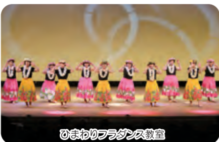
ひまわりフラダンス教室