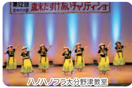
ハノノフラ大分野津教室