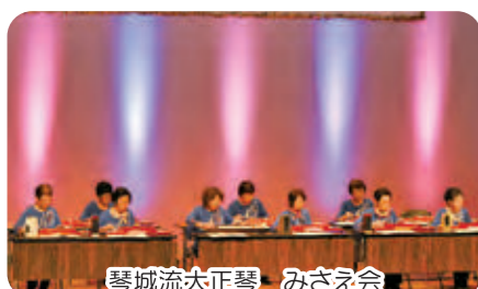
琴城流大正琴 みさえ会