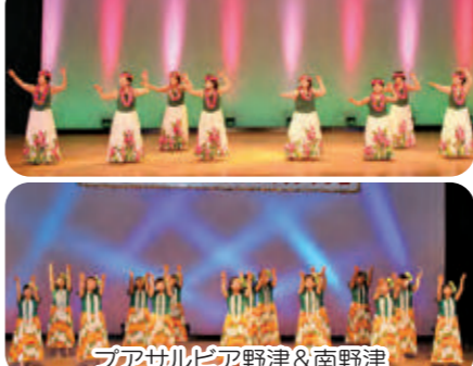
フアサルビア野津&南野津