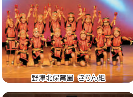
野津北保育園 きりん組