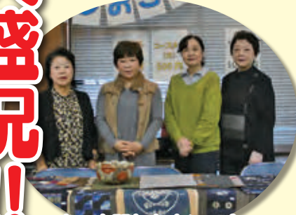
店・大間しおさいの会