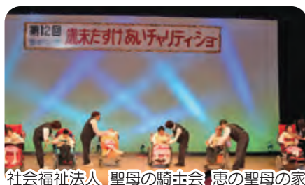
社会福祉法人 聖母の騎士会 恵の聖母の家