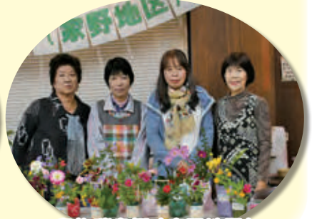
臼杵瑞泉郷(家野地区)