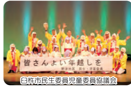
白杵市民生委員児童委員協議会