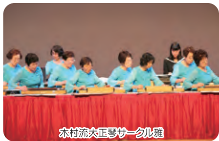
木村流大正琴サークル雅