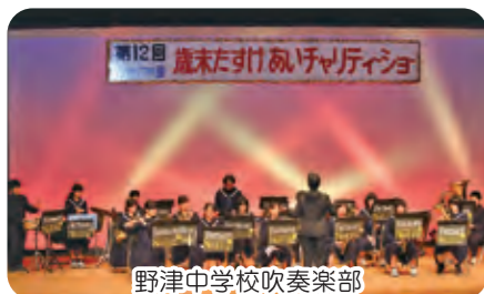
野津中学校吹奏楽部

11月27日(日)、野津中央公民館において昼の部・夜の部を行いました。来場者は、昼の部・夜の部とあわせて約1,000名の方々にご協力いただき、収益金は447,612円となり、歳末たすけあい募金といたしました。 市民皆様の温かい心に厚くお礼申し上げます。