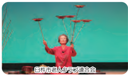
臼杵市老人クラブ連合会