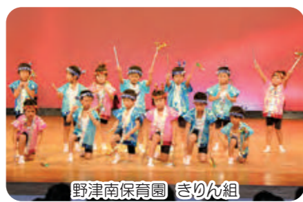
野津南保育園 きりん組