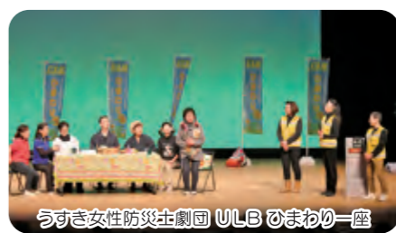
うすき女性防災土劇団 ULB ひまわり一座