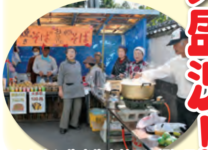
ふれあい生き生きサロン板知屋