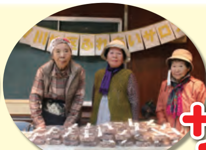
中ノ川地区ふれあいサロン