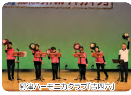
野津ハーモニカクラブ「吉四六」