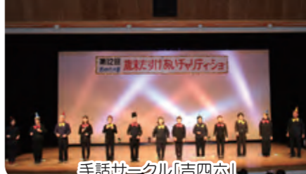
手話サークル「吉四六」