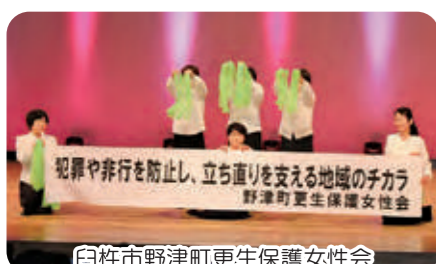
白杵市野津町更生保護女性会