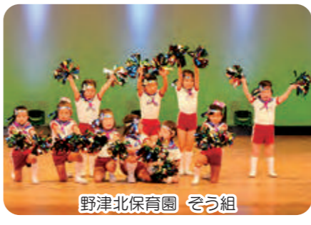
野津北保育園 そろ組