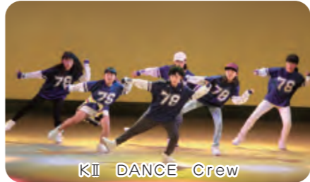
KII DANCE Crew