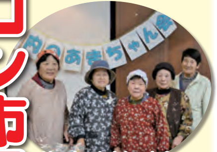
泊ヶ内のあまちゃん会