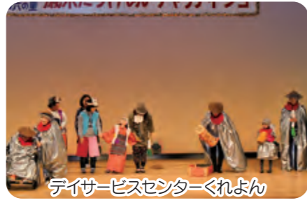
デイサービスセンターくれよん