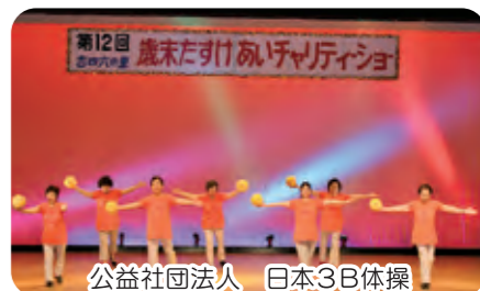
公益社団法人 日本3B体操