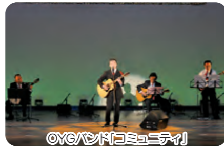
OYGバンド「コミュニティ」