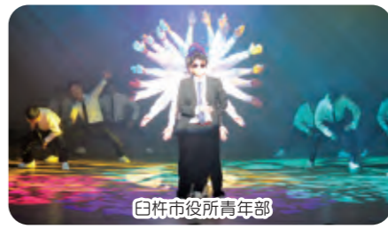
臼杵市役所青年部