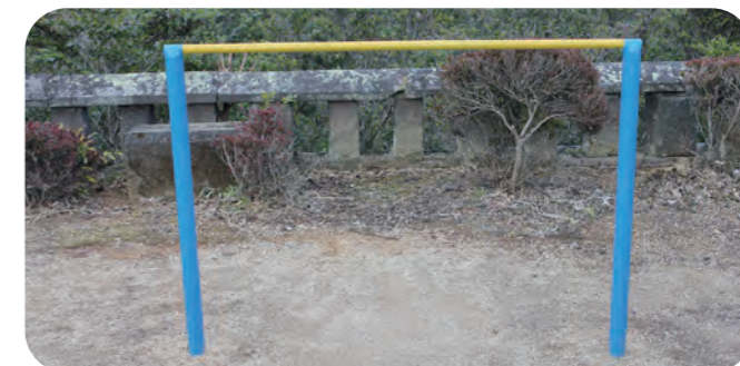
★荒田区こども公園 遊具改修★