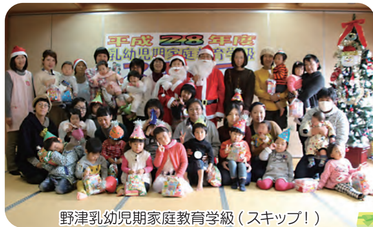
野津乳幼児期家庭教育学級（スキップ!）

10月1日から12月31日まで赤い羽根共同募金運動に取り組みました。市民皆様のご理解により、多くの募金が寄せられました。ご協力ありがとうございました。