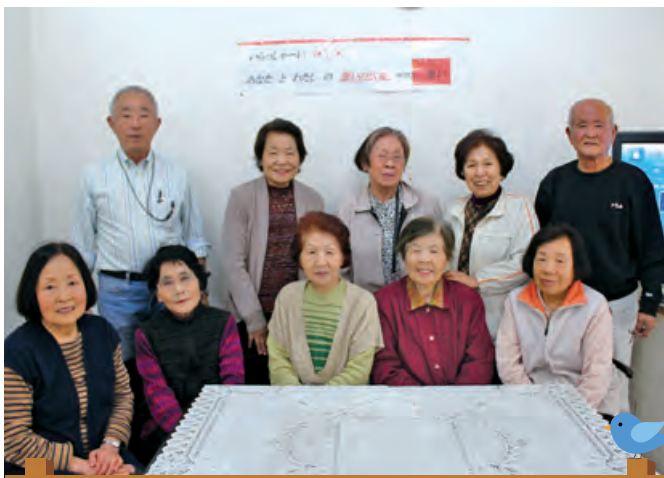
野津市街地の集い

◆臼杵市立下南保育所◆ 臼杵市大字望月 112番地の 1 TEL/0972-62-3630 FAX/0972-83-5650 e-mail: simominami@usukisyakyo.ecnet.jp