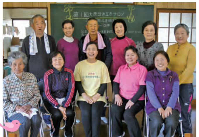
大西生き生きサロン(野津)