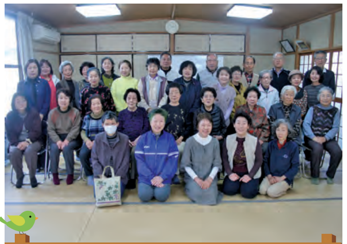
元気アップ街なか教室IN海添地区