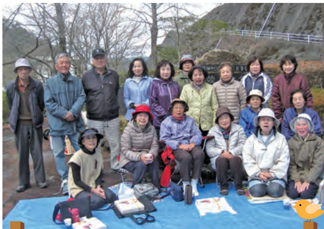
田井ヶ迫なごみ会