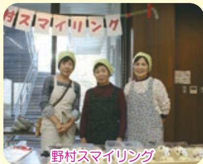
野村スマイリング