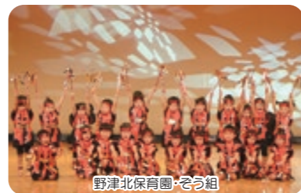
野津北保育園・そう組

12月2日(日)、野津中央公民館で昼の部・夜の部2回公演を行いました。昼の部・夜の部あわせて約900名の皆様にご来場いただき、収益金406,574円は、歳末たすけあい募金に寄付させていただきました。 市民皆様の温かい心に厚くお礼申し上げます。