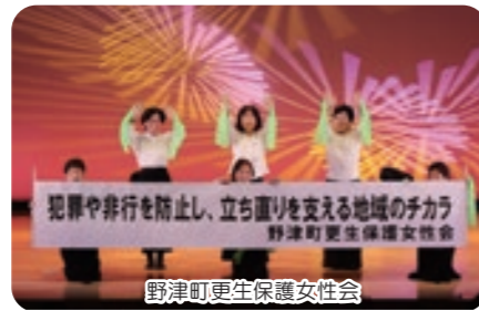
野津町更生保護女性会