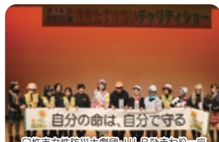
白栴市女性防災士劇団・ULBひまわり一座