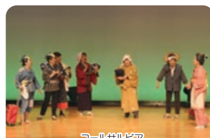
コーラルサルビア