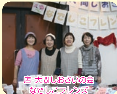
店・大間しおさいの会 なでしこフレンズ