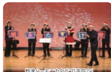
野津ハーモニクラブ(吉四六)