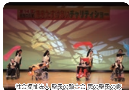
社会福祉法人 聖母の騎士会 恵の聖母の家