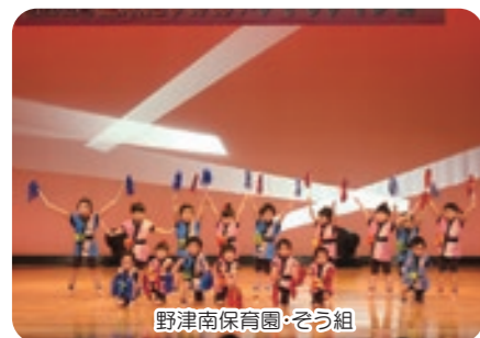
野津南保育園・そう組