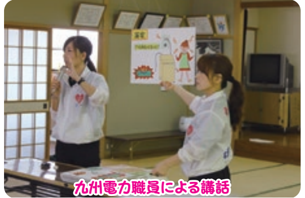
九州電力職員による講話

最後に、このオールデンカーに搭載されているIH キッキングヒーターで作ったカレーをサロンの皆さんで楽しみました。