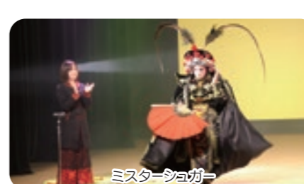
ミスター・ショガー