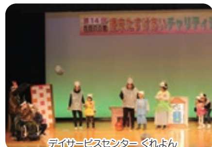
デイサービセンター くれよん