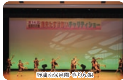
野津南保育園・きりん組