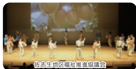
佐志生地区福祉推進協議会