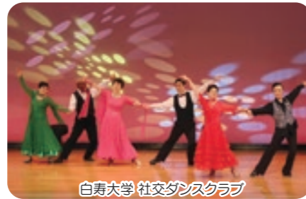
白寿大学 社交ダンスクラブ