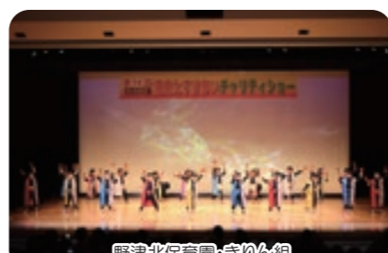
野津北保育園・きりん組