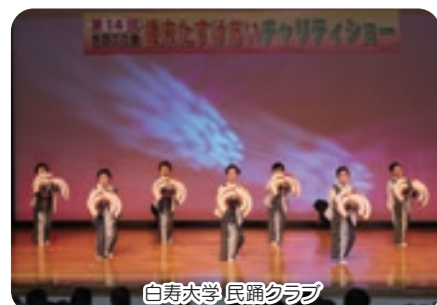
白寿大学 民謡クラブ