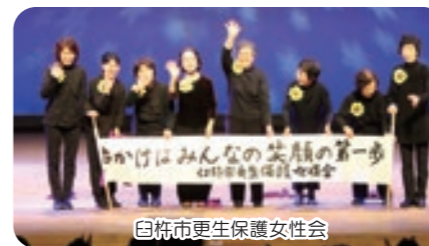
臼杵市更生保護女性会