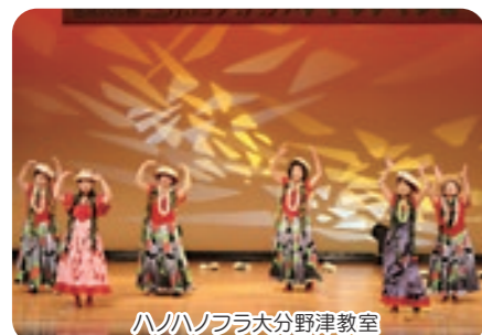
ハノノフラ大分野津教室