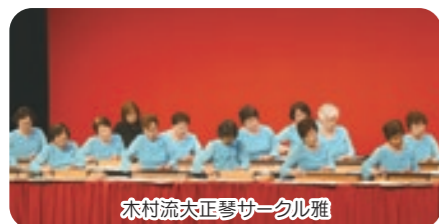
木村流大正琴サークル雅