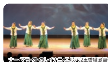
ナー・マモ・オ・カレイ・ニ・エリア兒玉香織教室