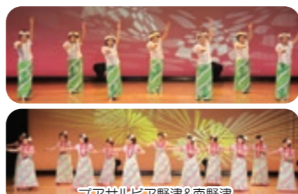
プアサルビア野津&南野津