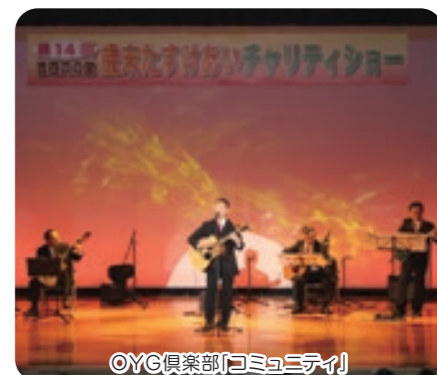
OYC倶楽部「コミュニティ」