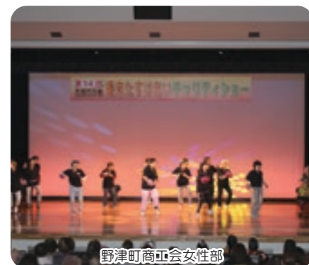
野津町商工会女性部