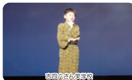
吉四六さん笑学校