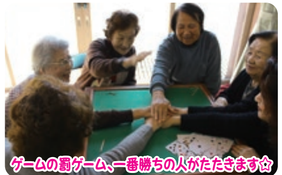
ゲームの罰ゲーム、一番勝ちの人がたたきます☆