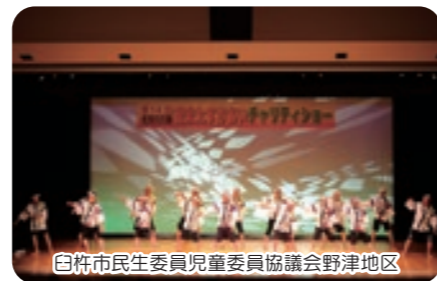
白栴市民生委員児童委員協議会野津地区