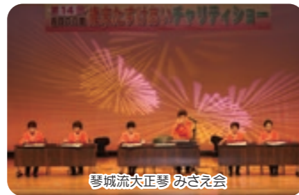
琴城流大正琴 みさえ会