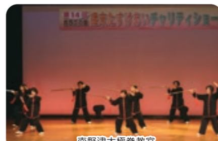
南野津太極拳教室