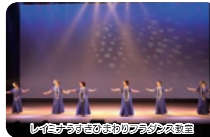
レイミナうすきまわりフラダンス教室