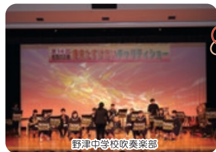
野津中学校吹奏楽部