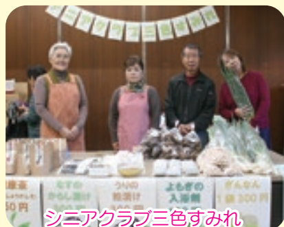
シニアクラブ三色すみれ