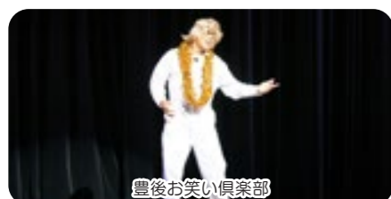
豊後お笑い倶楽部