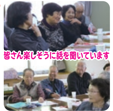
皆さん楽しそうに話を聞いています