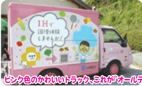
ピンク色のかわいいトラック、これが「オールデンカー」です! 普段は九州を飛び回っています。