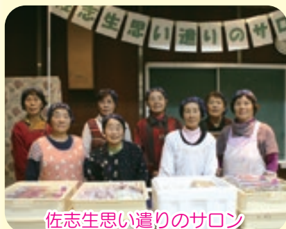
佐志生思い遣りのサロン