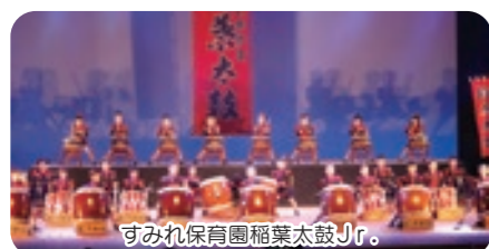
すみれ保育園稲葉太鼓Jr.