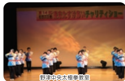
野津中央太極拳教室