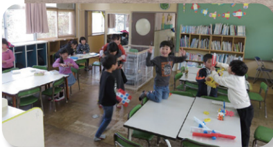
南野津放課後児童クラブ