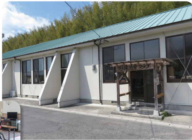
野津放課後児童クラブ