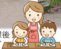
川登放課後児童クラブ