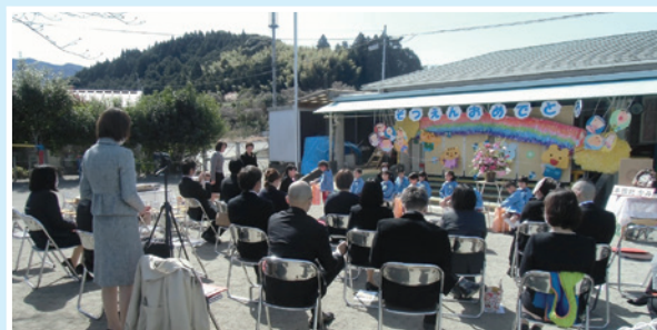
青空の下、下南保育所で行われた最後の「卒園式」