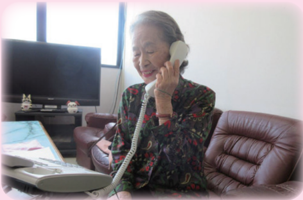
さわやか電話サービス