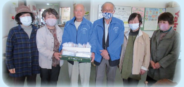
亀城大学リサイクルクラブ有志様 たくさんの寄贈ありがとうございました。

また、この活動は5月末日まで行いますので、皆様のご協力を今後もよろしくお願いします。