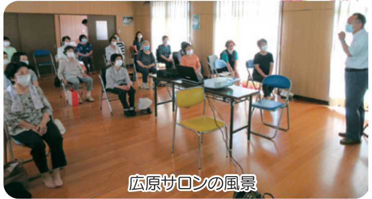
広原サロンの風景

適宜、水分補給を行い熱中症にならない対策も取り入れながら、サロン活動を行いましょう。