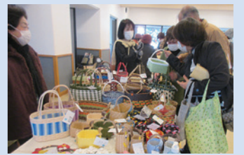
サロン市場の様子