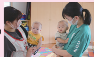
夏のボランティア体験の様子