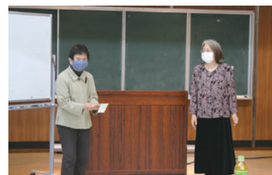
臼杵市ボランティア連絡協議会よりご寄付

※寄付者名・金額等の掲載につきましては、寄付者ご本人の承諾のもと掲載させていただいております。