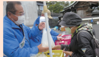
チャリティーバザーの様子