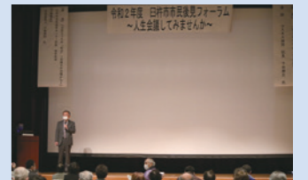
後見フォーラムの様子