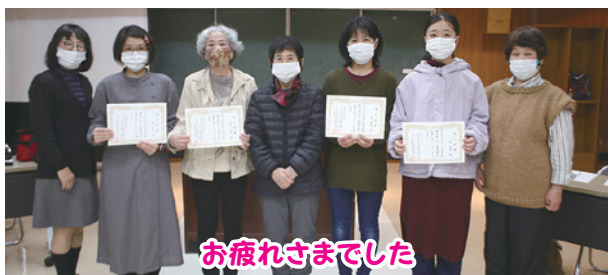
お疲れさまでした

【内容】 入門課程・基礎課程 全47回 【場所】 臼杵市社会福祉センター 2階中会議室 【費用】 無料 (初回時にテキスト代7,100円が必要です)