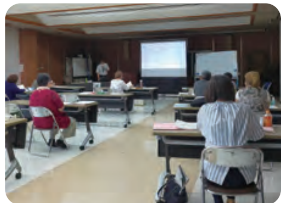
第8期生の受講風景です