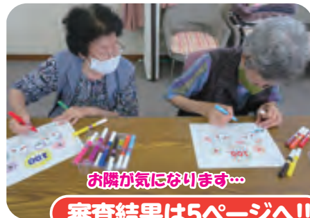
お隣が気になります…