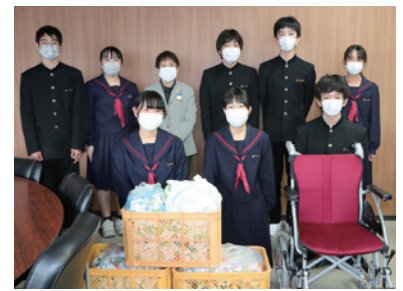
大切にに使わせていただきます