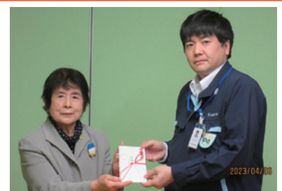
SBカワスミ株式会社様