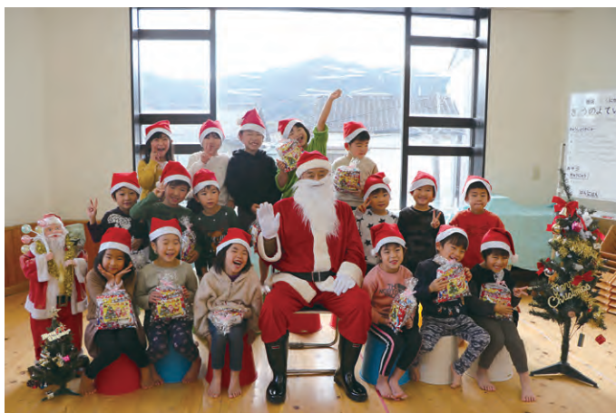
クリスマスプレゼント