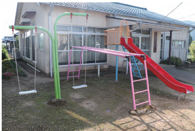
こども公園遊具改修