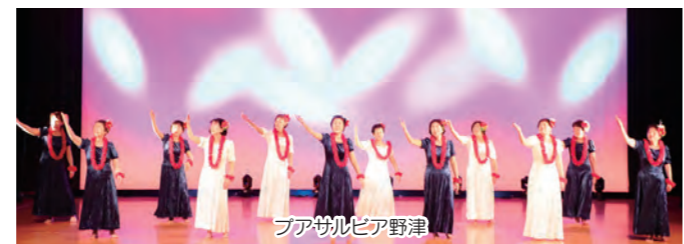
フアサルビア野津