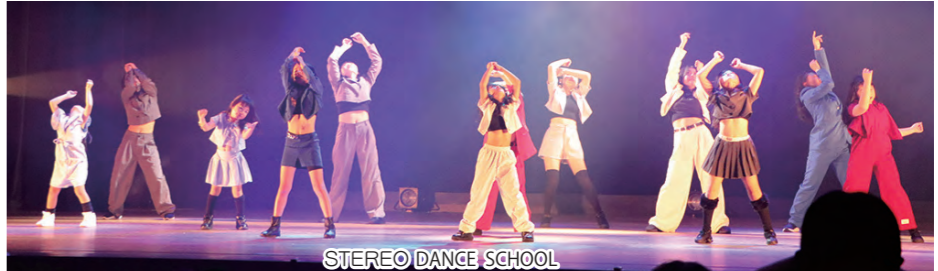
STEREO DANCE SCHOOL

12月3日(日)、白杵市民会館で公演を行いました。 765名の皆様にご来場いただき、収益金779,918円は、歳末たすけあい募金に寄付させていただきました。 市民皆様の温かい心に厚くお礼申し上げます。