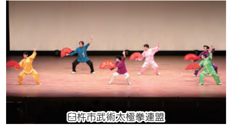
白杵市武術太極拳連盟