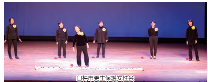
白杵市更生保護女性会