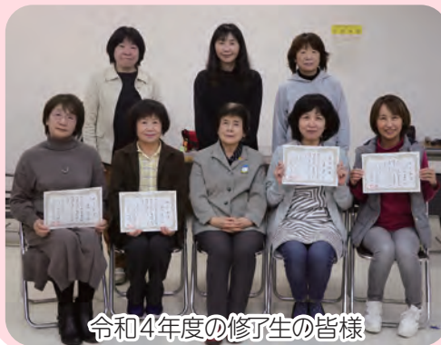
令和4年度の修了生の皆様