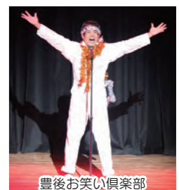
豊後お笑い倶楽部