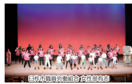
白杵市職員労働組合 女性部有志