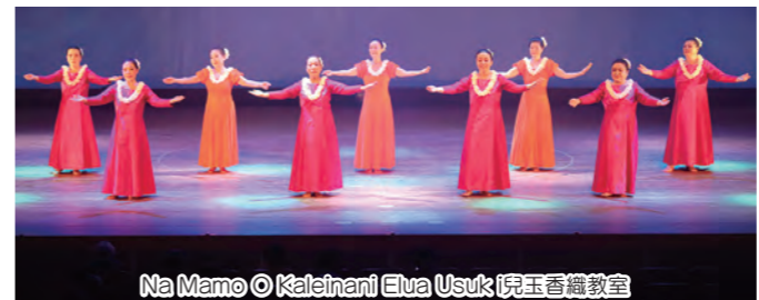
Na Mamo © Kaleinani Elua Usuk 児玉香織教室