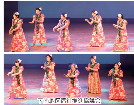
下南区福祉推進協議会