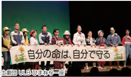
自分の命は、自分で守る