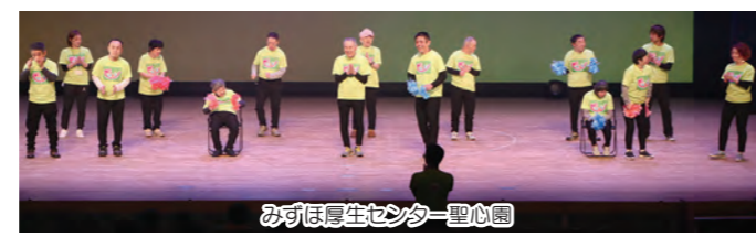
みずほ厚生センター聖心園