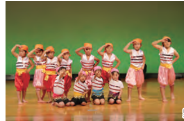
野津南保育園きりん組