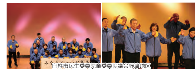
白栴市民生委員児童委員協議会野津地区