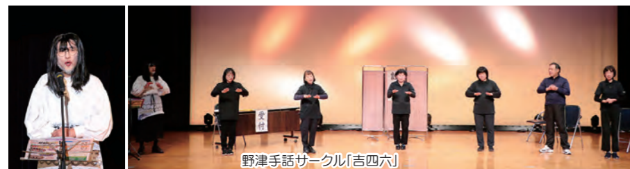
野津手話サークル「吉四六」