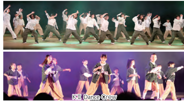
KII Dance Crew