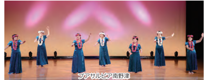
フアサルビア南野津