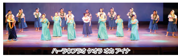
ハーラウフラオクオラ オカ アイナ