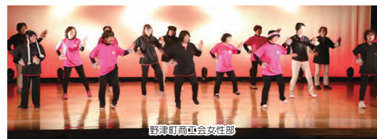
野津町商工会女性部