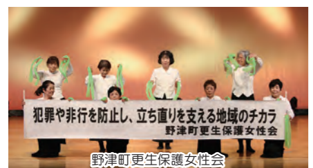
野津町更生保護女性会