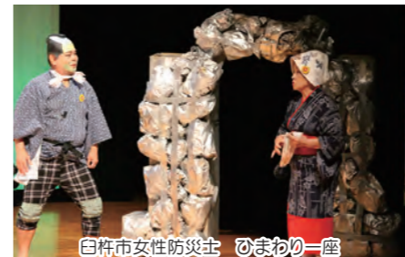
白栴市女性防火士 ひまわり一座