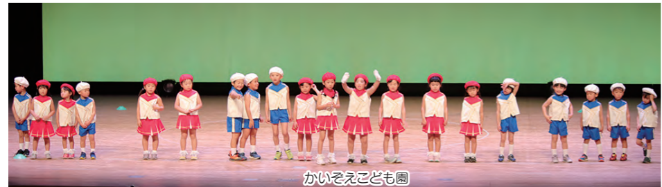
かいそえこども園

12月3日(日)、白杵市民会館で公演を行いました。 765名の皆様にご来場いただき、収益金779,918円は、歳末たすけあい募金に寄付させていただきました。 市民皆様の温かい心に厚くお礼申し上げます。