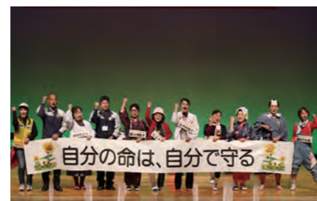
自分の命は、自分で守る